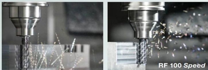
通常のエンドミル (左) とRF100 Speedの切り屑形状

RF100 Speed ロングバージョン (品番6766) には、チップブレイカーとしてニックを外周切れ刃に設け、切り屑を細かく分断し、切り屑排出性を向上させます。さらに、びびり振動を抑制し切削抵抗を低減します。細かく分断された切り屑は、自動化された製造ラインでの機械内部からの切り屑搬出を円滑にし、切削性能とともに生産性を向上します。