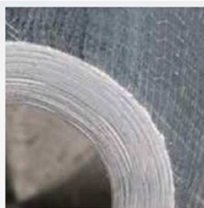
一般工具での加工面